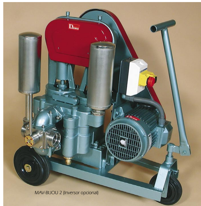
MAV-BIJOU 2 (Inversor opcional)