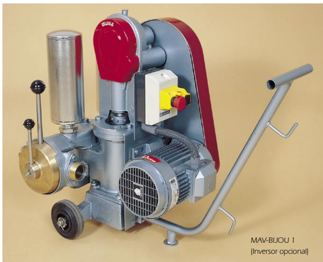
MAV-BIJOU 1 (Inversor opcional)